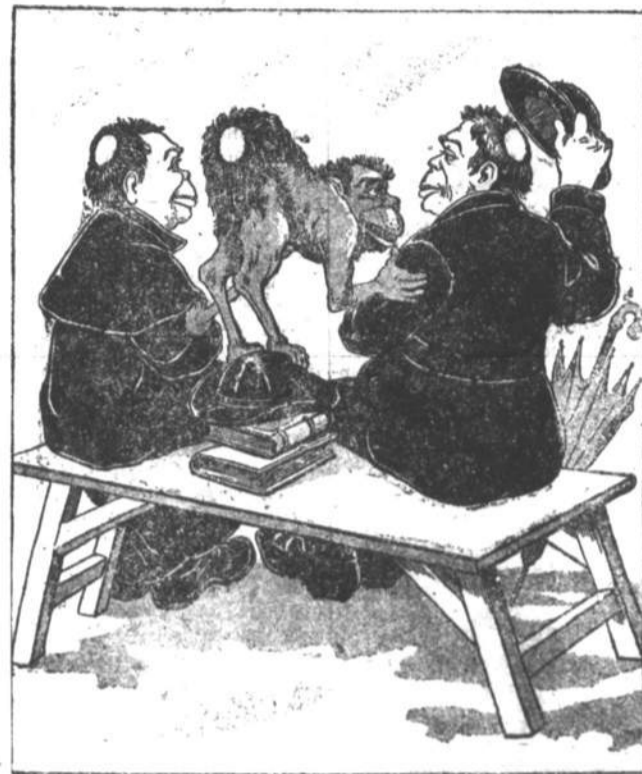
Os que negam a paternidade do macaco

Carolismo habitual e inveterado — cura-se com a divinação da Lanterna.